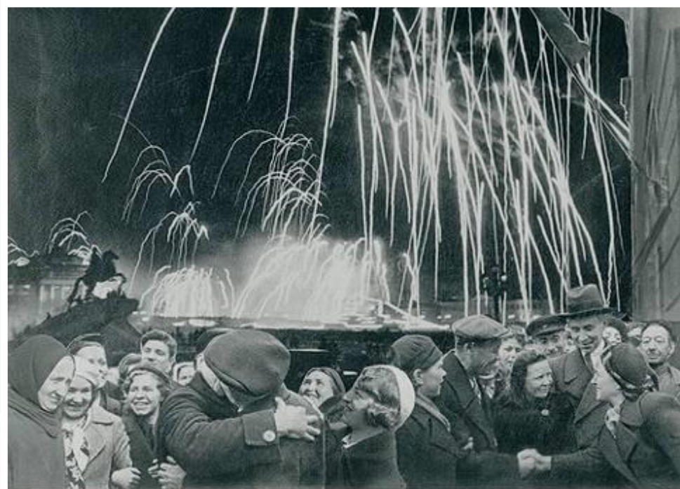
-Великая победа одержана советскими войсками под Ленинградом:

Победе радовалась вся страна, но эта радость была со слезами на глазах, так как в каждой семье, в каждом доме кто-то погиб на этой страшной войне.